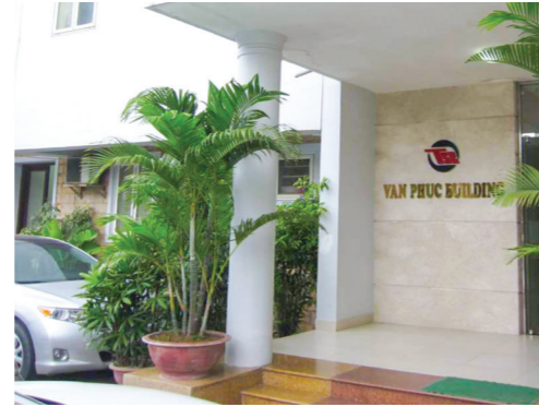
ABB人材・国際貿易の本社